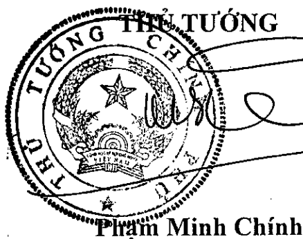
Phạm Minh Chính