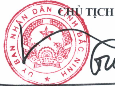
Vương Quốc Tuấn