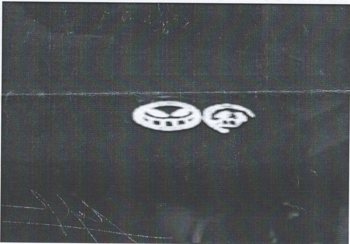
02 (hai) logo hình tròn, nền trắng, họa tiết đen ở ngực áo bên trái của đối tượng.